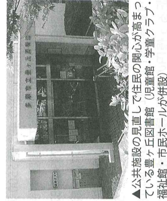
▲公共施設の見直しで住民の関心が高まっている豊ヶ丘図書館（児童館・学童クラブ・福祉館・市民ホールが併設）